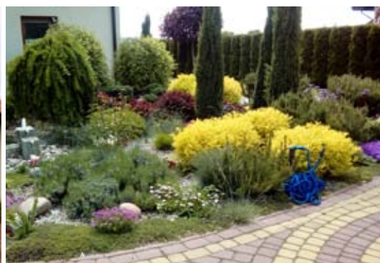
III miejsce posesja Danuty Woźnica z Żabiej Woli