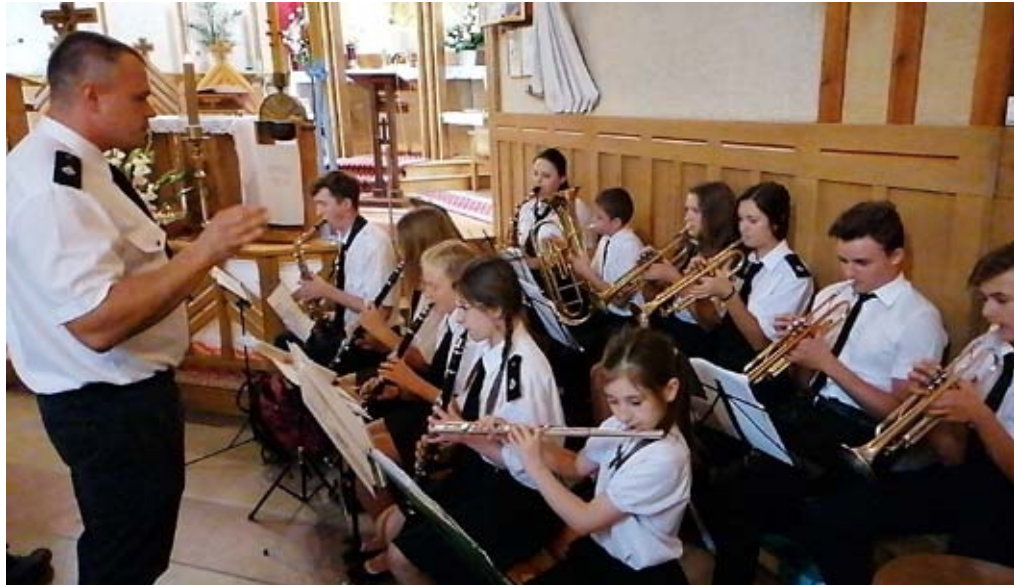
Młodzieżowa Orkiestra Dęta