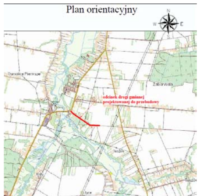
Odcinek drogi gminnej nr 112486L, który zostanie przebudowany