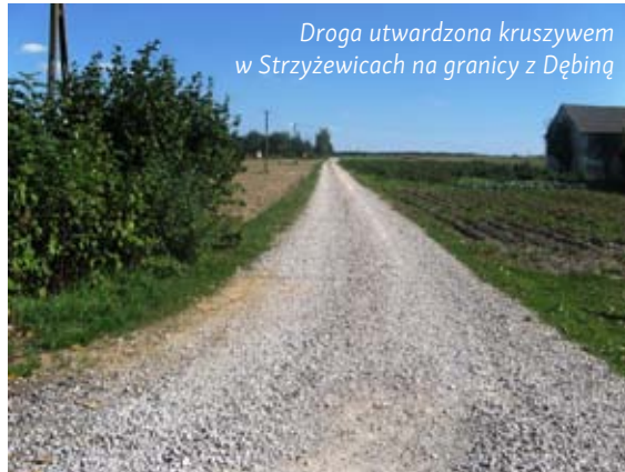
Droga utwardzona kruszywem w Strzyżewicach na granicy z Dębnią

Gmina pozyskała nieodpłatnie od Zarządu Dróg Wojewódzkich w Lublinie 2000 ton destruktu – frezu asfaltowego o wartości 130 000,00 zł, którym utwardzono 2,94 km dróg gminnych w następujących miejscowościach: Pawtów, Osmolice Drugie, Polanówka, Borkowizna, Żabia Wola, Polanówka, Kolonia Kiełczewice Dolne.