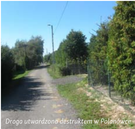
Droga utwardzona destruktem w Polanówce