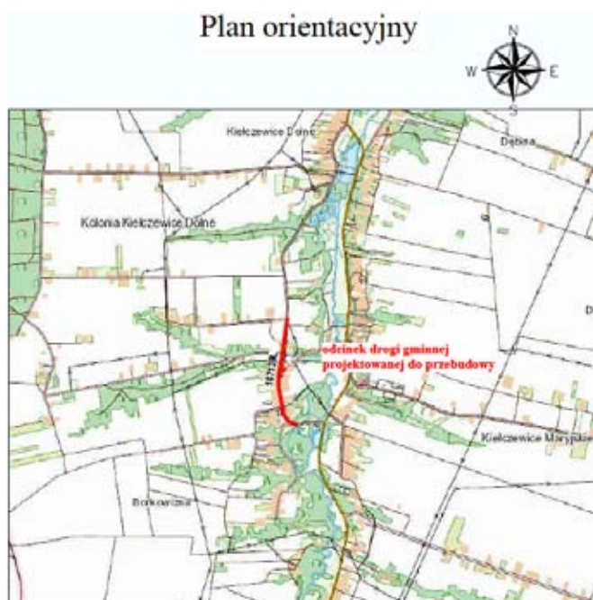
Odcinek drogi gminnej nr 107139L, który zostanie przebudowany

Planowany termin zakończenia inwestycji: wrzesień 2020 r.