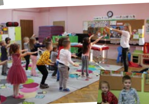
Zajęcia z fizjoterapeutką