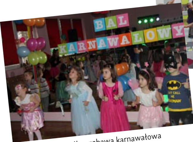
Wspólna zabawa karnawałowa