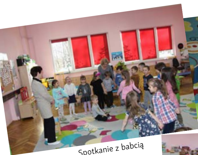
Spotkanie z babcią

Kolejny raz rodzice dzieci przedszkolnych pokazali że można liczyć na ich pomoc i dobrą organizację. Serdecznie dziękujemy za poświęcony czas i współpracę aby tradycyjnie, Dzień Babci i Dziadka w naszym przedszkolu połączył trzy pokolenia.