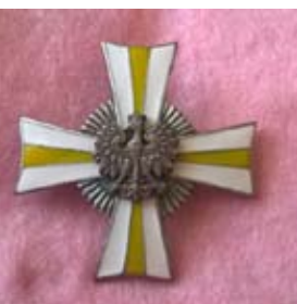
Odznaka 24 Pułku Ułanów