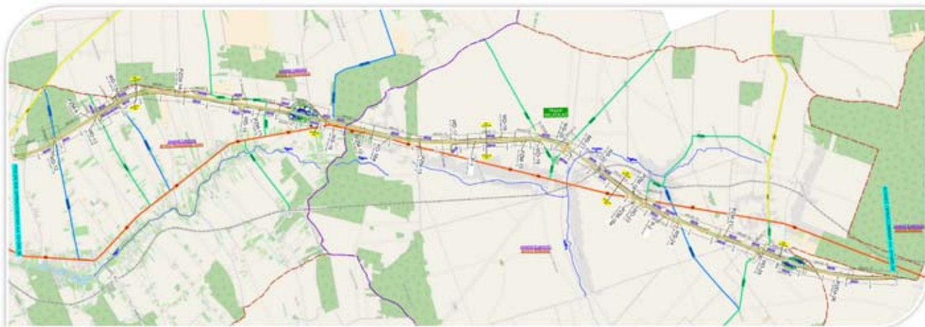
Rysunek 1. Schemat przebiegu projektowanego odcinka S19

Projekt i budowa drogi ekspresowej S19 Lublin – Rzeszów, odc. Lublin – koniec obw. Kraśnika: Część nr 2: odc. realizacyjny węzeł „Niedrzwica D.” obecnie „Niedrzwica Duża” (bez węzła) – Kraśnik (węzeł „Kraśnik” obecnie „Kraśnik Północ” – bez węzła) początek obwodnicy, długości ok. 20 km