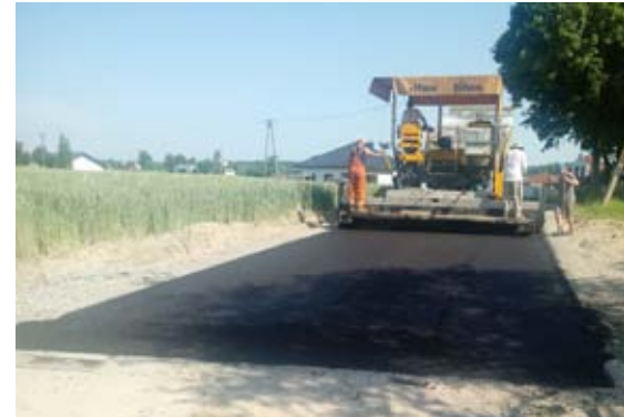
Droga gminna nr 112496L w Piotrowicach w trakcie robót

Rozpoczęły się remonty dróg o nawierzchni tłuczniowej – na ciągach drogowych roz-