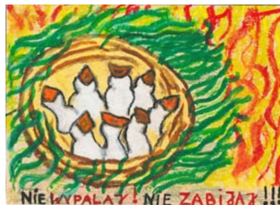
Autor Karolina Teter PSP w Bystrzycy Starej