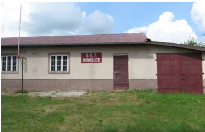
Budynek OSP w Osmolicach Pierwszych