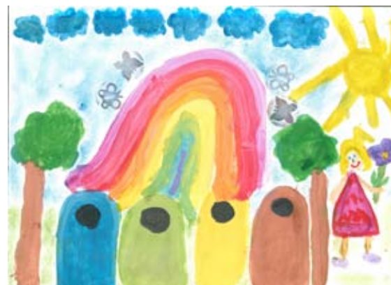
Autor Zuzanna Szymańska PSP w Żabiej Woli