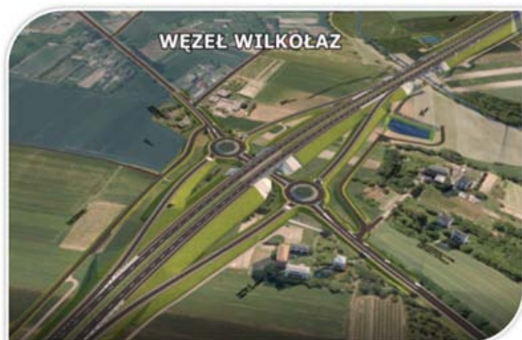
Rysunek 2. Fragment wizualizacji

Pochodną celu podstawowego jest również usprawnienie wymiany turystycznej oraz kulturowej pomiędzy krajami członkowskimi Unii Europejskiej.