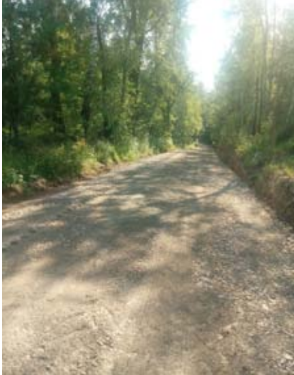
Droga gminna nr 112510L w Borkowiznie