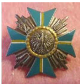
Odznaka 21 Pułku Ułanów