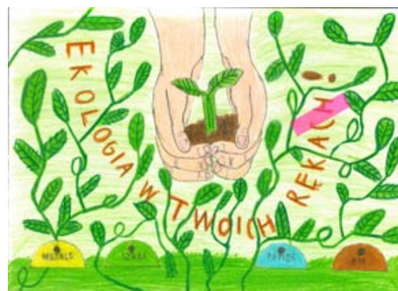
Autor Łukasz Kostruba PSP w Osmolicach Pierwszych