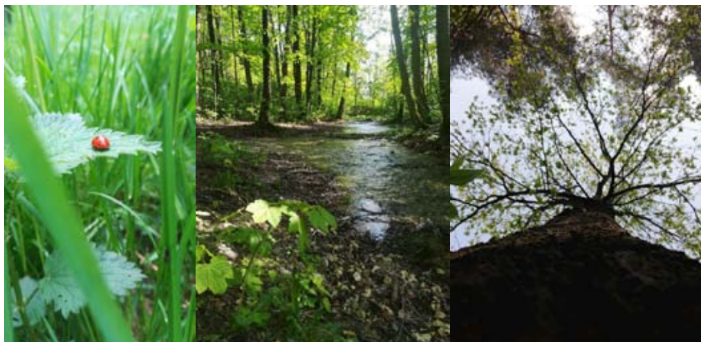
Natalia Słowak PSP w Żabiej Woli