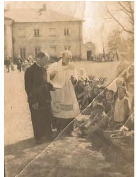
Święcenie pokarmów przed pałacem w Osmolicach, 1942 r.

na którym królowało jajko - od wieków uważane za symbol początku i źródło życia. Odmawiano wspólnie modlitwę, po której senior rodu dzielił „święconym” i składał sobie życzenia wszelkiej pomyślności i zdrowia. Na Lubelszczyźnie popularnym zwyczajem było kolędowanie wielkanocne. W wielu wsiach wczesnym rankiem gromadki małych chłopców chodziły po tzw. dyngusie, lejokach lub lejusiach i śpiewały najrozmaitsze pieśni wielkopostne lub wygłaszały zabawne wierszyki, prosząc o dary. Repertuar tekstów był dość różnorodny. Tworzyły go przede wszystkim pieśni dyngusowe i pieśni gajkowe. Nieodłącznym elementem i symbolem Świąt Wielkanocnych są także pisanki. Wykonywano je powszechnie w Wielkim Tygodniu. Pisanki lubelskie należą do jednych z najładniejszych w Polsce, wyróżniając się wysokim poziomem artystycznym.